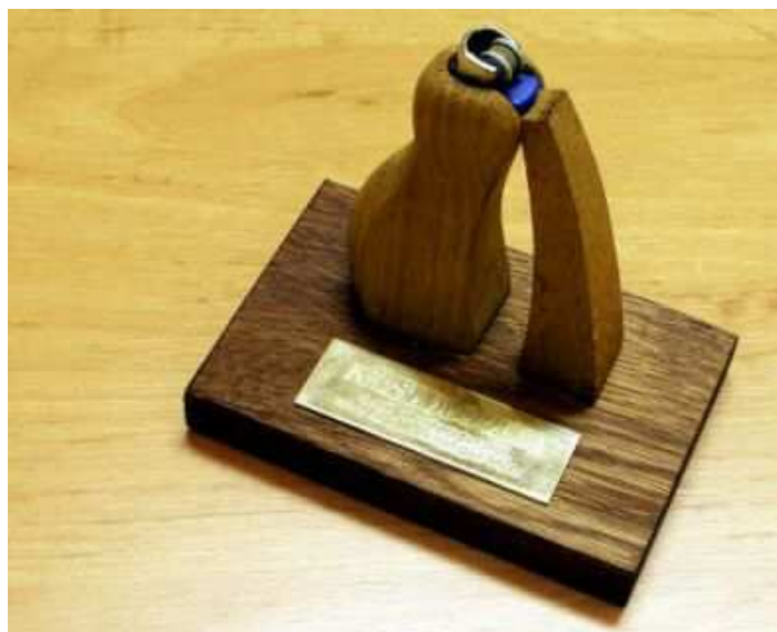
Křesadlo 2001 - 2002

Za rok 2002 to bylo celkem 31 křesadel, které kromě Prahy předávali naši partneři v šesti městech – Česká Lípa, České Budějovice, Pelhřimov, Olomouc, Ústí nad Labem a Zlín.